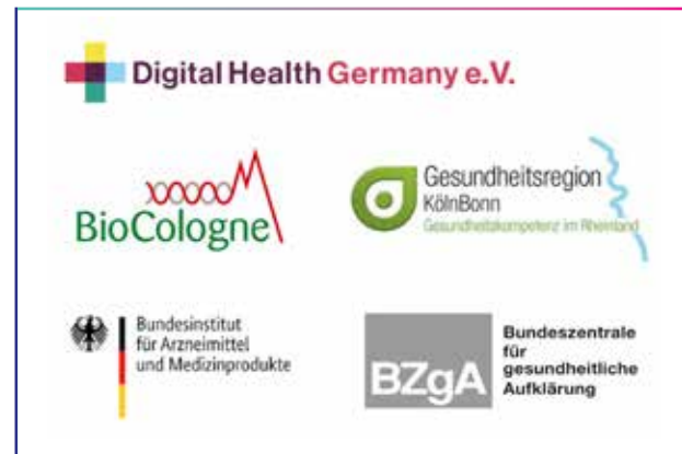
مركز للكفاءة الطبية تُعدُّ كولون موطناً للعديد من الهيئات والشبكات الطبية

لذا، فإن عملية الانتقال من البحث إلى التطبيق يدعمها العديد من أصحاب المصلحة الذين يمثلون جهات متعددة، كشركة «باير»، شركة العلوم الحياتية الرائدة عالمياً التي تتخذ من مدينة «ليفركوزن» المجاورة مقراً لها، والتي تأسست منذ أكثر من 150 عاماً. وبالطبع، نحن لا نحترق خبراتنا لأنفسنا في كولون؛ فعلاوة على كون مدينتنا واحدة من أهم مدن المعارض التجارية الدولية، فإنها تُعدُّ أيضاً موطناً للعديد من المؤتمرات الصناعية المتخصصة في علوم الصحة والحياة، بما فيها «بيرميديكون» و«مؤتمر الصحة الغربي». إضافة إلى معرض طب الأسنان الدولي، المعرض التجاري الرائد عالمياً في قطاع طب الأسنان، الذي سيحتفل في عامنا الجاري 2023 بمرور مئة عام على انطلاقه في كولون التي يقام فيها كل عامين منذ عام 1923. وهذا كله يثبت أن كولون تتمتع بأعلى المعايير التي يمكنكم الوثوق بها دوماً.