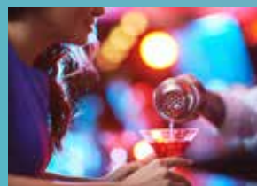
كولون ليلد متعة الحياة الليلية الرائعة بانتظارك في حاضرة الراين

مع عدد لا يُحصى من الفعاليات الحيّة التي تلائم جميع الأذواق على اختلافها. وسواء أكنت تبحث عن قضاء ليلة نابضة بالمتعة، أم عن شيء من الكوميديا الجادّة التي تجعلك تذرّف الدموع من الضحك؛ فستجد كل ما تتوق إليه في أي ليلة من ليالي كولون. ولمن يستمتعون بالمقامرة، هناك عدد من الكازينوهات الراقية التي يسهل الوصول إليها من المدينة، كتلك الموجودة مثلاً في مدينتيّ «آخن» أو «باد نويبار».