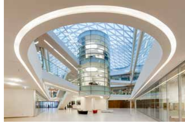
معهد «ماكس بلانك» لبيولوجيا الشيخوخة

إلا أن تميّز كولون لا يقتصر على العلوم النظرية فقط؛ فهي تُعدُّ أيضاً مركزاً ناشطاً في تطبيق نتائج أحدث الأبحاث العلمية على أرض الواقع بأسرع وقت ممكن. وابتداءً من التكنولوجيا الحيوية والتكنولوجيا الطبية، وصولاً إلى الصحة الرقمية، تحتضن كولون أكثر من 200 شركة متخصصة في مجال الرعاية الصحية تشكّل المحرّك الأقوى للابتكار والنمو في المدينة. كما توفر مراكز تكنولوجية؛ مثل: «بيو كامباس كولون» و«ريتر كولون»، للشركات، سواء الناشئة أو المتوسطة أو الكبيرة، مساحة ملائمة لتبادل الابتكار والتعاون في شتى التخصصات. وعلاوة على ذلك، تسهم أكثر من 60 شركة ناشئة وصغيرة في إثراء هذه الصناعة بحلول مبتكرة ومستقبلية. كما تضم المدينة العديد من الشبكات الصناعية؛ مثل: «بيو ريفر - العلوم الحياتية في راينلاند»، و«ديجيتال هيلث ألمانيا»، و«بيو كولون»، و«منطقة كولون-بون الصحية»، إلى جانب الهيئات الفيدرالية؛ مثل: المركز الفيدرالي للتقني الصحي (BZgA)، والمعهد الفيدرالي للأدوية والأجهزة الطبية (BfArM)، والتي تعزز دوماً عملية تبادل الخبرات على مختلف الصُّعد.