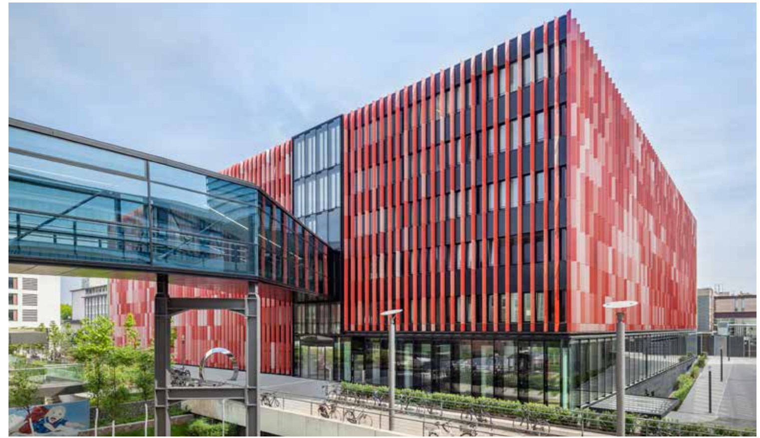
مركز الأورام المتكامل CIO، مستشفى كولين الجامعي

تتميّز البنية الطبية في كولين بمجموعة واسعة من الخبرات في تشخيص وعلاج الأمراض الباطنية. ففي قسم الطبّ الباطني في مستشفى «هولفايده»، ستجد فريقاً من المهنيين متعدّدي التخصصات وذوي الخبرات الرفيعة، مستخدمين أحدث المعدّات الطبية؛ للارتقاء بمستوى تشخيص وعلاج العديد من الأمراض إلى مستويات جديدة. وفي داخل الأقسام المختلفة، تتكاتف جهود العيادات والبحوث بشكل مكثف للعمل على قضايا محورية خاصة، تشمل الأمراض المعقدة والنادرة، لاسيّما في طب الأوعية (أمراض الأوردة والشرايين والأوعية اللمفاوية)، وأمراض السكري، وأمراض الجهاز الهضمي، وأمراض الرئة والكلى، وأمراض الجهاز المناعي. ويضاف إلى ذلك أن نتائج البحوث العلمية الصادرة