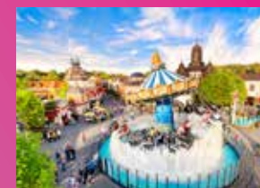
"فانتازيا لاند" حديقة ملاهي رائعة توفر ترفيهاً عائلياً مدهلاً في ضواحي كولون

تُعَدُّ حاضرة الراين مكاناً مثالياً لقضاء أوقات ترفيهية ممتعة إلى أقصى الحدود، إذ تقدّم مجموعة متكاملة من وسائل الترفيه؛ من الثقافة العالية إلى الفرحة الطفولي الغامر. حديقة الحيوان في كولون تشتهر عالمياً بمتنزه الفيلة، وتتصل مع متنزه الراين الشاسع الذي يضمّ النافورة الشهيرة «تانتس برونن» ومنتجع «كلوديوس» الساحر بطرازه الروماني القديم الفريد عن طريق التلفريك الذي يعبر فوق نهر الراين. أما المتحف الألماني للألعاب الرياضية والأولمبية، فيُعتبر متحفاً رائعاً للشغوفين بالرياضات، إذ يتيح لهم ممارسة كرة القدم وكرة السلة على سطحه. لكن، هل تبحث عن مزيد من المرح والتشويق؟ إذاً، توجّه إلى حديقة الملاهي «فانتازيا لاند» الضخمة في مدينة «برول» المجاورة، أو سِرْ على حُطى «مايكل شوماخر» عبر زيارة مضمار الكارت الخاص بعائلته في مدينة «كيربن» القريبة. ففي «موتور وورلد كولون»،