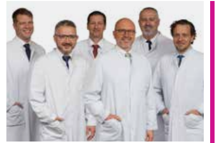
كبار الأطباء في عيادة آتوس

آتوس أورثوبارك في خدمة المرضى الدوليين: للحصول على موعد أو نصائح طبية أو رأي طبي ثاني، يرجى الاتصال بإدارة المرضى الدوليين. وسوف يكون اختصاصيوننا سعداء بتقييم وتائقك خلال وقت قصير. علاوة على ذلك، فإننا نقدم توصيات مختصرة على الإنترنت مجاناً.