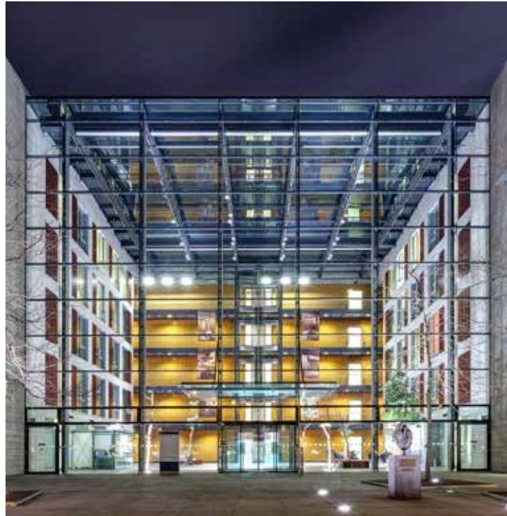
مركز القلب في مستشفى كولون الجامعي

علاوةً على ذلك، افتتح مركز أمراض القلب والتخطيط في المستشفى البلدي، حديثاً، قسم «طبّ القلب المستقبلي» الذي يجمع فريقاً من الخبراء البارزين في مختلف التخصصات؛ ليعملوا معاً تحت سقف واحد. وبفضل تجهيزه بواحد من أحدث مختبرات قسطرة القلب، شهد هذا القسم تحسناً مُستداماً في عمليات التشخيص عالي الدقة، إذ بإمكان المعالجين المتخصصين الانتقال، بكل مرونة، بين صور الأشعة السينية وتخطيط القلب والصور ثلاثية الأبعاد للقلب. وكما تلاحظون، فقد تمّ إعداد كل شيء في كولون لضمان رفاهية المرضى وراحتهم.